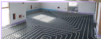
Riscaldamento a pavimento