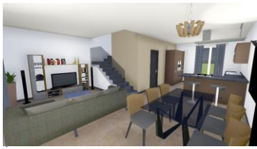
La tecnologia dei nostri vetri

POSSIBILITA' DI PERMUTA DA PARTE DELL'IMPRESA